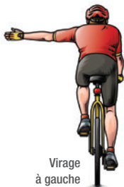
Virage à gauche

... sur une distance suffisante pour être bien vu par les autres usagers.